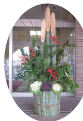
立派な門松が出来ました

12月19日、鳥取県高齢者大学校卒業生でつくる『緑を愛する仲間』の皆様によりボランティアで門松を作成頂きました。お蔭様で良いお正月を迎えることができました。誠にありがとうございました。