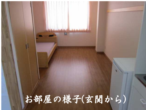
お部屋の様子(玄関から)