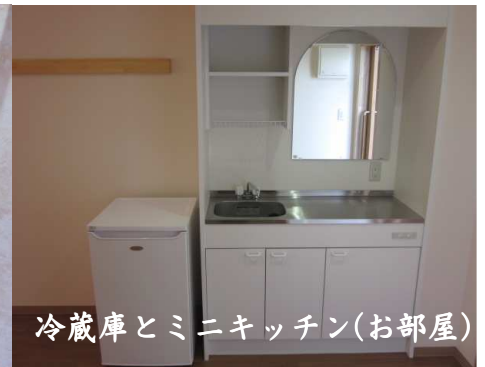
冷蔵庫とミニキッチン(お部屋)